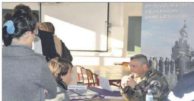
Les rencontres sont légion entre jeunes et professionnels.

Pour le coup, 120 professionnels seront présents pour répondre aux - très - nombreuses interrogations de jeunes gens parfois à l'orée du monde du travail. Soulignons aussi que plusieurs écoles et autres filières seront également présentes. Sans oublier les